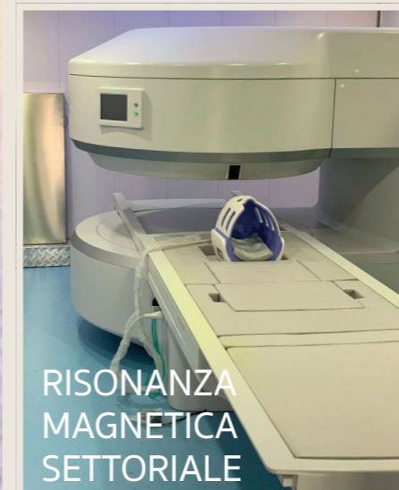
RISONANZA MAGNETICA SETTORIALE

ha selezionato consulenti medici e sanitari per realizzare una offerta ampia e di qualità consistente in 80 ATTIVITÀ SPECIALISTICHE E DIAGNOSTICHE CON ALTRETTANTI PROFESSIONISTI.