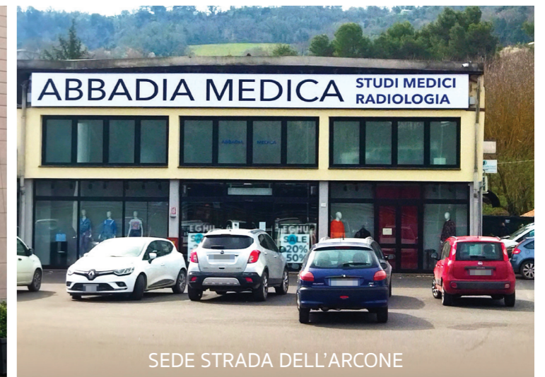
SEDE STRADA DELL'ARCONA