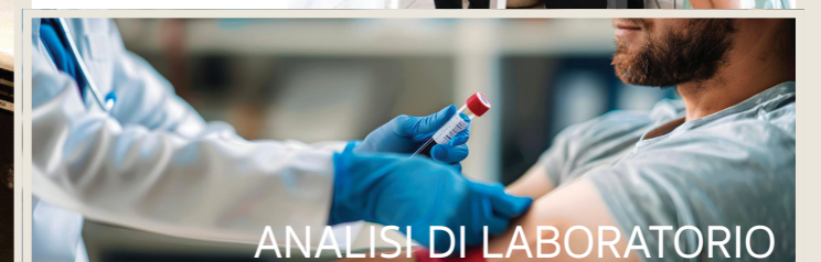
ANALISI DI LABORATORIO