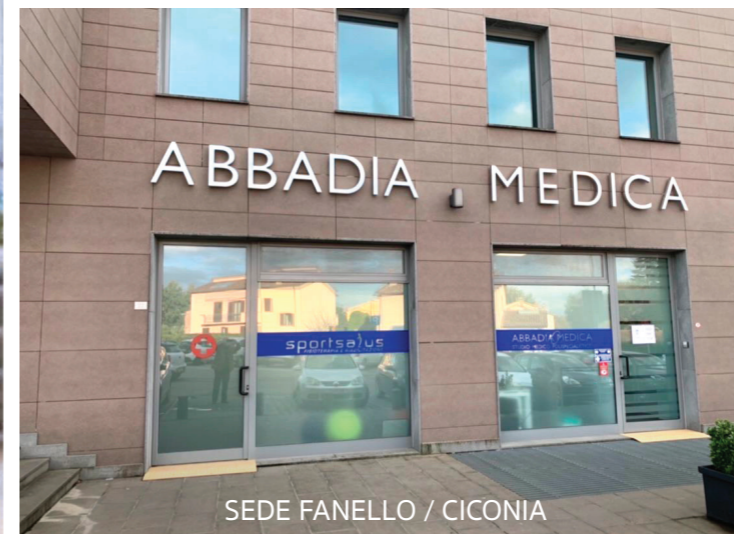
SEDE FANELLO / CICONIA