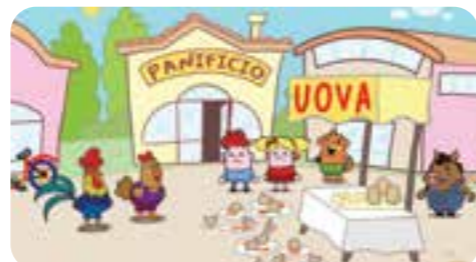
È un birbante che ha rubato uova, farina e zucchero. Vuole fare una torta, ma gli manca un ingrediente...