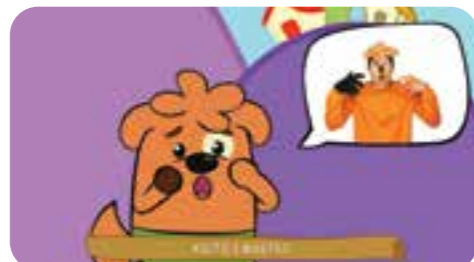
correre nel MagiRegno dove trovano Zampacorta spaventato: il Mostro Zannuto terrorizza tutti!