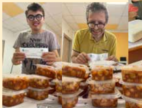
Questa pagina è stata realizzata GRAZIE al contributo di Corradini Serramenti.