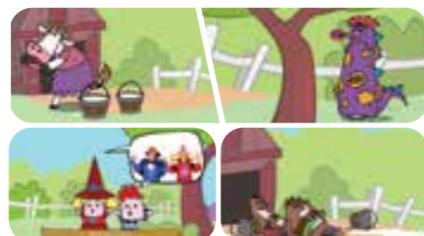
Vedendoli il mostro si spaventa e cade... sono Tordo e Tondo, che volevano fare una sorpresa al Duca.