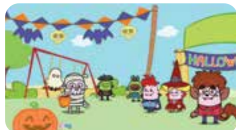
Oggi è Halloween e i fratellini lasciano i loro amici mascherati che giocano al Parco dell'Elefante per...