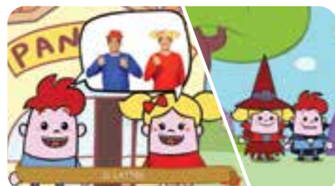
il latte! Lampadino e Caramella si vestono da strega e vampiro e corrono alla fattoria di Erminia Bovina.