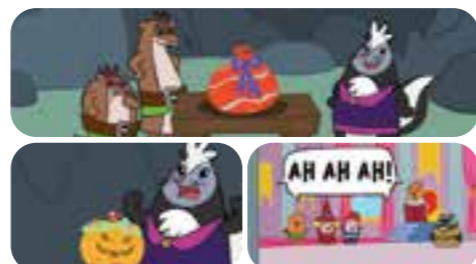
I fratellini decidono di aiutarli con la torta, ma col dolcetto arriva anche... un piccolo scherzetto!

NON PERDETE LA PROSSIMA USCITA PER VIVERE ALTRE FANTASTICHE AVVENTURE DI LAMPADINO E CARMELLA!