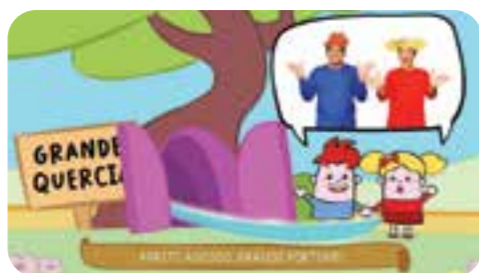
Chiamati da Zilia, Lampadino e Caramella corrono sotto la Grande Quercia e sono trasportati nel MagiRegno...