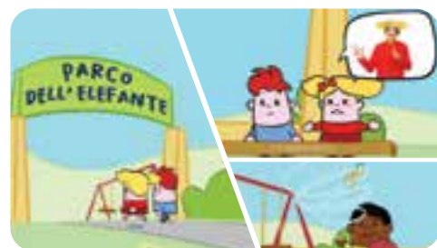
Oggi i fratellini arrivano al Parco dell'Elefante, proprio mentre un mulinello di vento fa volare il cappello di Willy.

AMICI, CHI VINCERÀ LA GARA DI MONGOLFIERE? Riusciranno i fratellini Lampadino e Caramella a smascherare le faine Tordo e Tondo per contrastare il loro perfido scherzo? Voliamo insieme a scoprirlo!