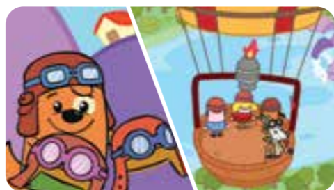
dove Zampacorta li attende per partecipare ad una gara di mongolfiere! Indossati i caschi si può iniziare!