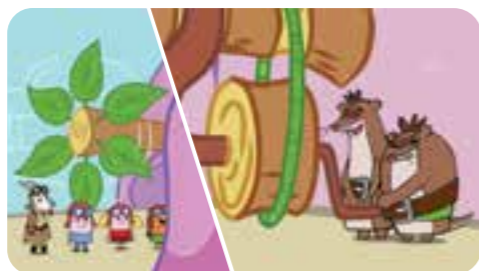
I quattro amici scoprono così un'enorme ventola manovrata dalle due perfide faine che, smascherate, fuggono via!