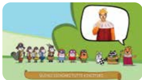
Recuperati gli altri concorrenti, tornano al Giardino Reale, dove tutti vengono proclamati vincitori dal Re!

NON PERDETE LA PROSSIMA USCITA PER VIVERE ALTRE FANTASTICHE AVVENTURE DI LAMPADINO E CAMELLA!