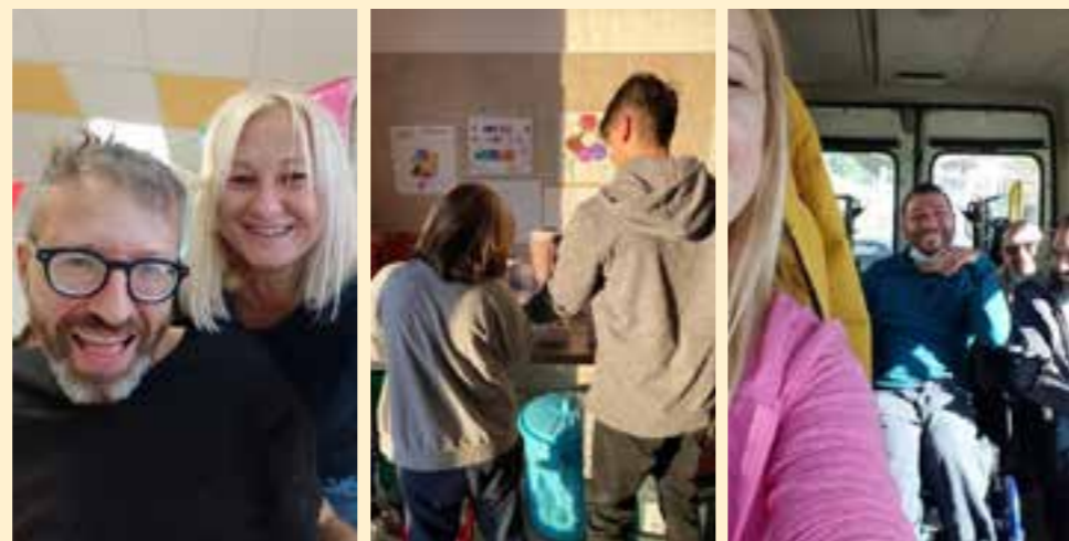
Questa pagina è stata realizzata GRAZIE al contributo di Corradini Serramenti.