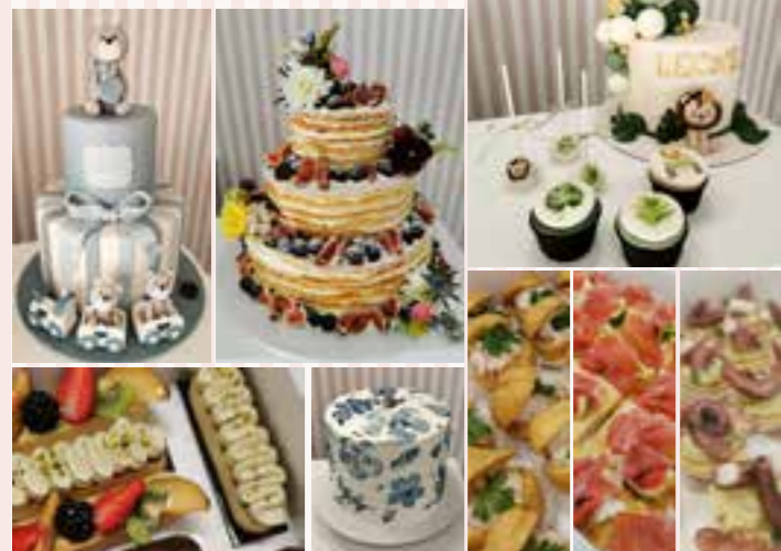
Realizzazione buffet dolci e salati Torte personalizzate su ordinazione

L'attenzione ai particolari fa la differenza!