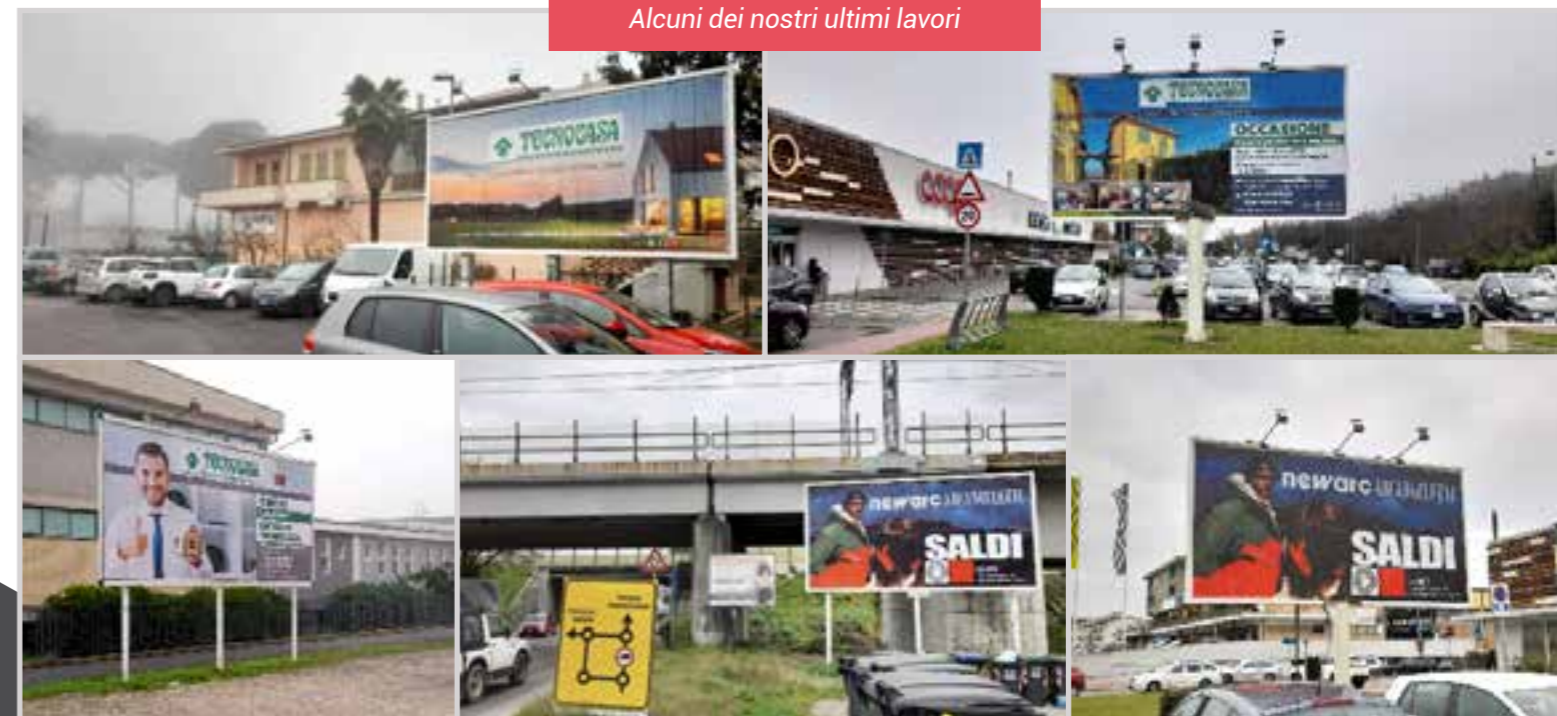
Alcuni dei nostri ultimi lavori

CANTINA BIGI Località Ponte Giulio, 3 Orvieto TR Tel. 0763/315888 · bigi@giv.it