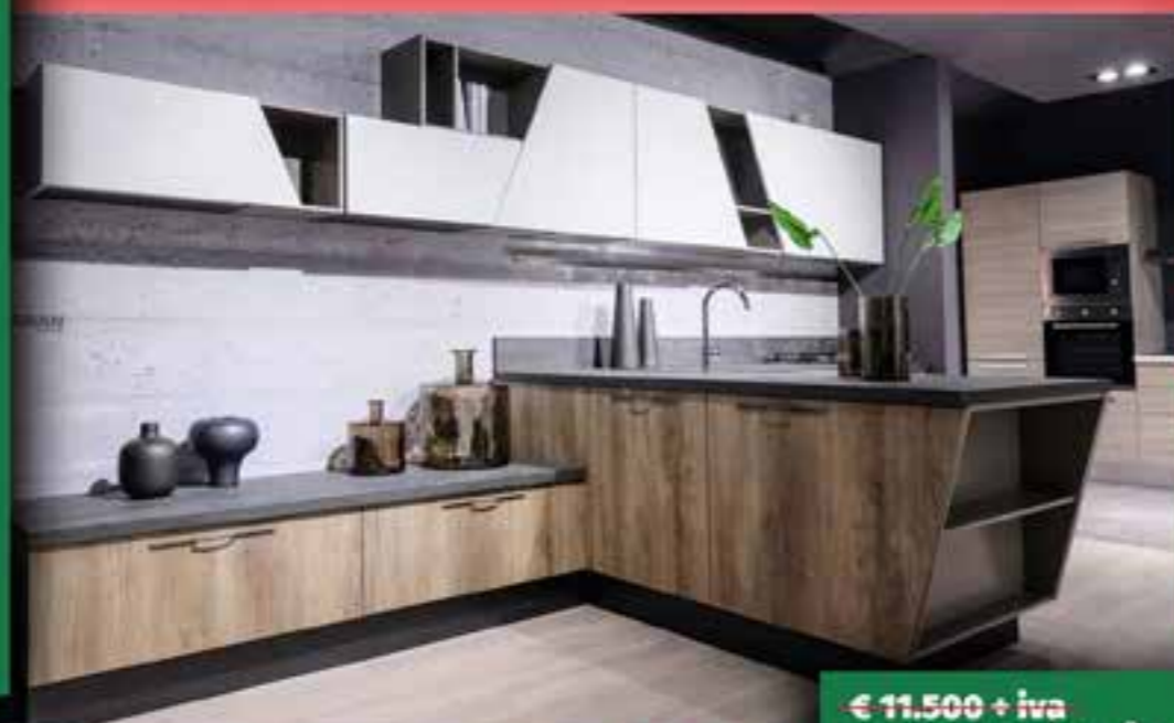
Composizione fissa come da foto.

€ 11.500 + iva € 6.500 + iva posa inclusa