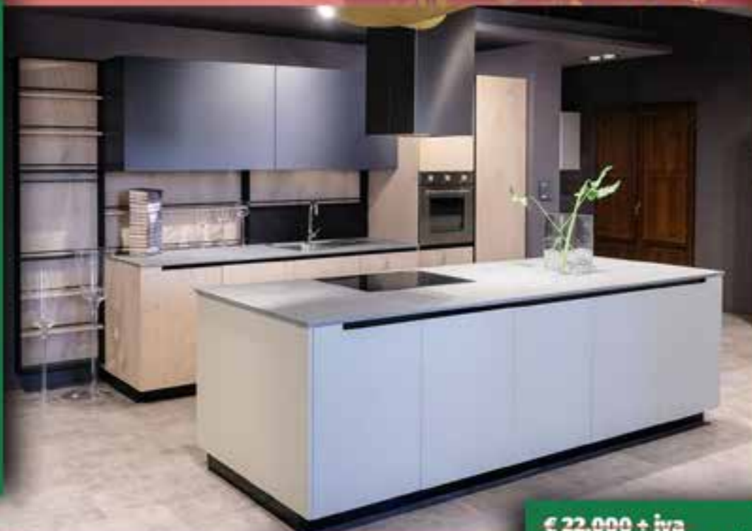
Composizione fissa come da foto.

€ 22.000 + iva € 12.000 + iva posa inclusa