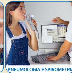
PNEUMOLOGIA E SPIROMETRIA