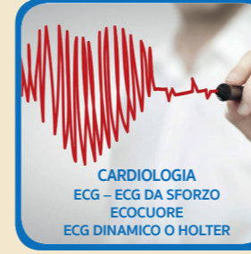
CARDIOLOGIA ECG - ECG DA SFORZO ECOCUORE ECG DINAMICO O HOLTER