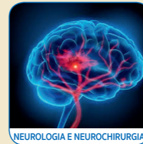
NEUROLOGIA E NEUROCHIRURGIA