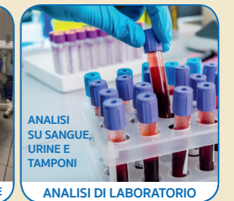
ANALISI SU SANGUE, URINE E TAMPONI