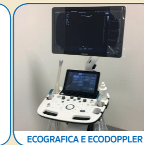
ECOGRAFICA E ECODOPPLER