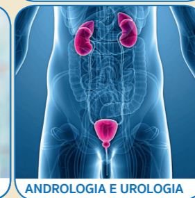
ANDROLOGIA E UROLOGIA