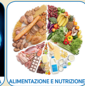
ALIMENTAZIONE E NUTRIZIONE