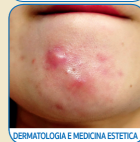
DERMATOLOGIA E MEDICINA ESTETICA