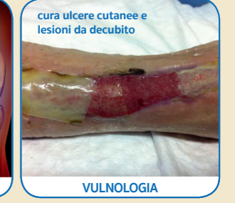
cura ulcere cutanee e lesioni da decubito