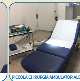
PICCOLA CHIRURGIA AMBULATORIALE