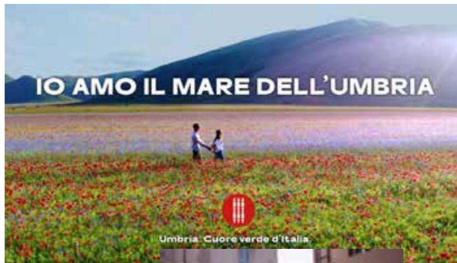
Umbria. Cuore verde d'Italia

“Io amo il mare dell’Umbria”: è il nuovo concept curioso, impattante, memorabile, semplice ed esaustivo ideato dall’Agenzia Armando Testa a cui è stata affidata l’ideazione del nuovo progetto integrato di comunicazione a sostegno della ripartenza turistica dell’Umbria. La campagna, su Tv, stampa, radio, digital e social, che veicola un messaggio forte, capace di attrarre nuovi visitatori, è on air da oggi, domenica 16 maggio.