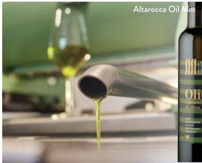
Altarocca Oil Mill

LA NUOVA LINEA COSMETICA NATURALE TRA OLIVETI E VIGNETI ALTAROCCA WINE SPA NASCE DALLA VOLONTÀ DI RISPETTARE L'UOMO E L'AMBIENTE IN CUI VIVIAMO CON PRODOTTI PULITI E SOSTENIBILI ED È IL RISULTATO DI UNA COLLAUDATA COMBINAZIONE COSMETICA TRA NATURA E SCIENZA FARMACOLOGICA