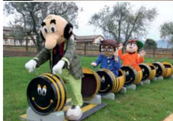
Fattoria Tellus è a disposizione per compleanni, cerimonie e ricorrenze.

La Fattoria Tellus è visitabile solo su prenotazione! Siamo aperti dal LUNEDÌ al VENEDÌ per accogliere le scuole di vario ordine e il SABATO e la DOMENICA per i bambini e le loro famiglie. ORARIO: dalle 9:00 alle 13:00