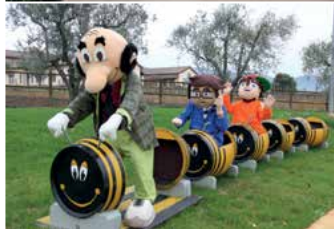
Fattoria Tellus è a disposizione per compleanni, cerimonie e ricorrenze.

La Fattoria Tellus è visitabile solo su prenotazione! Siamo aperti dal LUNEDÌ al VENERDÌ per accogliere le scuole di vario ordine e il SABATO e la DOMENICA per i bambini e le loro famiglie. ORARIO: dalle 9:00 alle 13:00