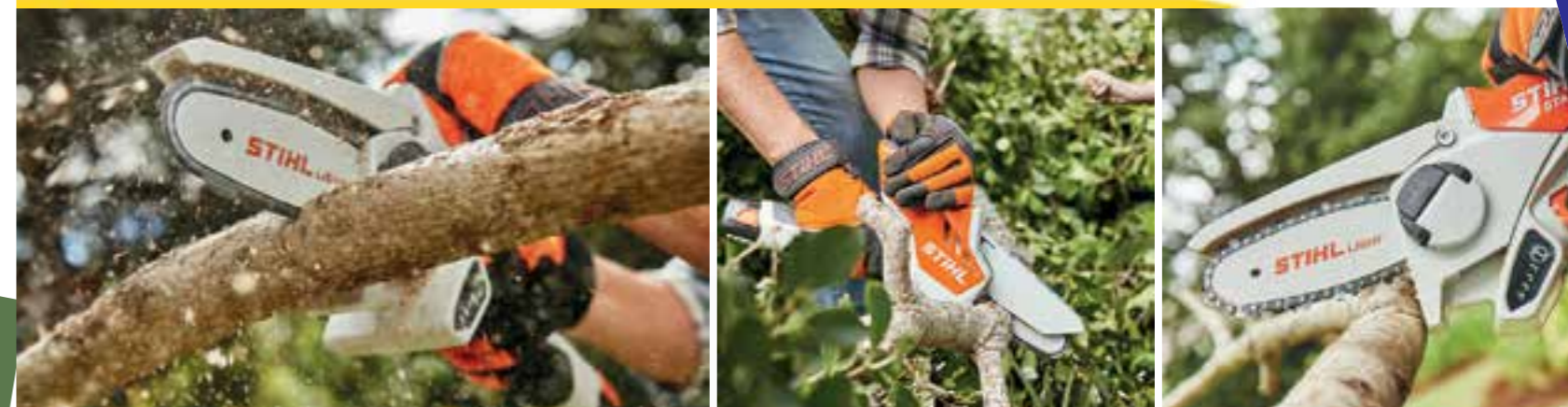
POTATORE A BATTERIA