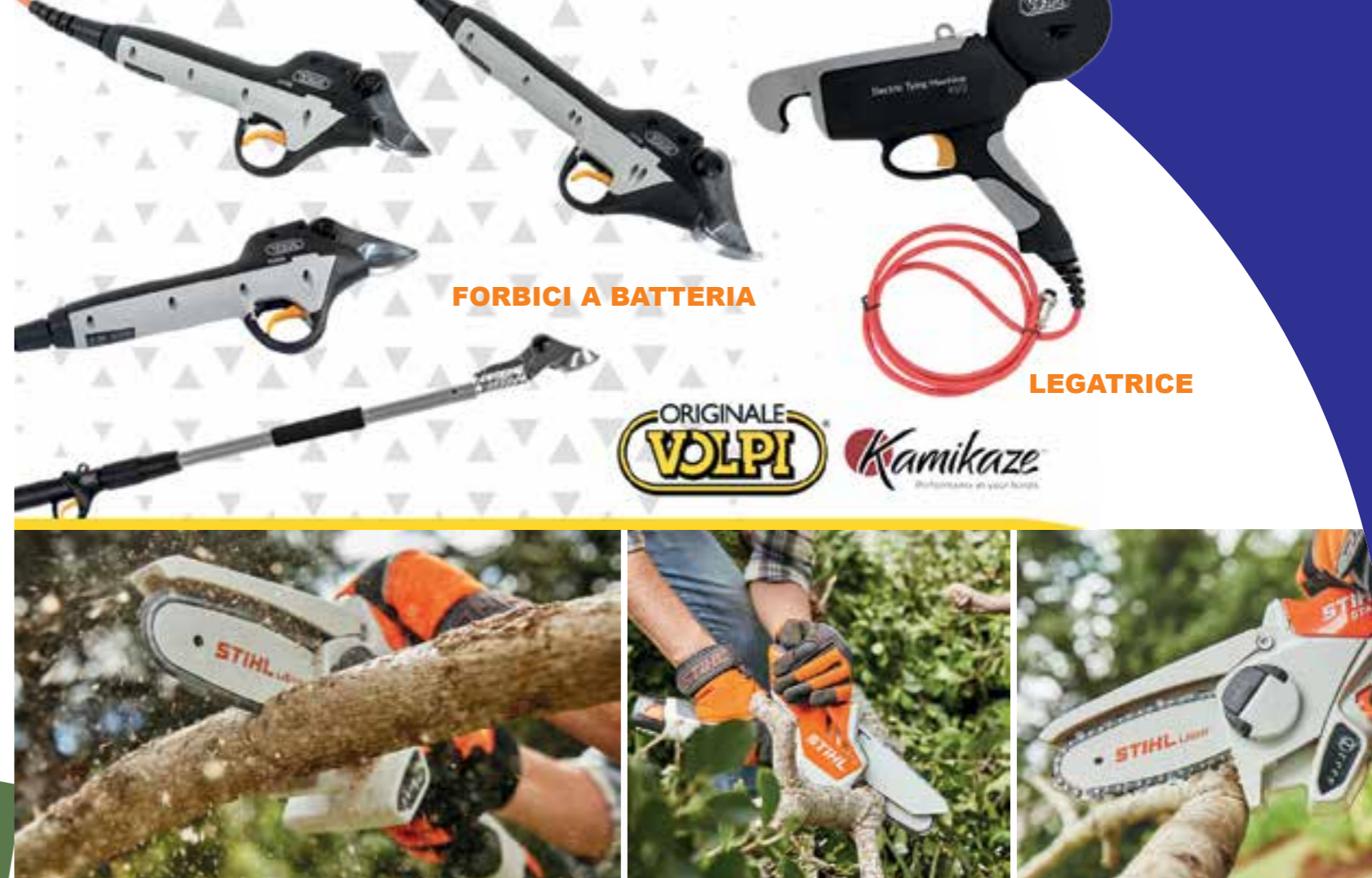
FORBICI A BATTERIA