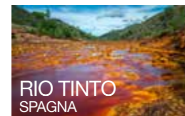
RIO TINTO SPAGNA

Anche se ora non possiamo spostarci come vorremmo la libertà di pensare al prossimo viaggio non ci è preclusa. Ecco alcune mete davvero particolari.