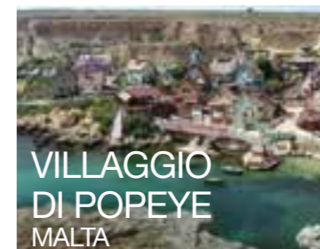
VILLAGGIO DI POPEYE MALTA

La meraviglia di questa natura è diversa da qualsiasi altra parte del mondo - è costruita da circa 40 000 colonne basaltiche che sono state incluse nell'elenco del patrimonio mondiale dell'UNESCO per la loro forma peculiare. Anche se queste rocce infatti sono il risultato di un'eruzione vulcanica, c'è ancora una leggenda che spiega che le rocce sono state costruite da un gigante (per questo il nome). Nel 1986 è stato aperto il Centro turistico di Selciato dove è possibile ottenere informazioni utili sul sito, cambiare i soldi e acquistare qualche souvenir.