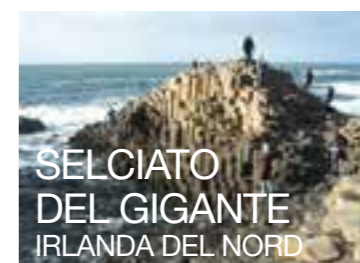
SELCIATO DEL GIGANTE IRLANDA DEL NORD

È in realtà una strada di 7 chilometri con 11 monumenti eretti, l'ultimo essendo le Porte della città di Hum.