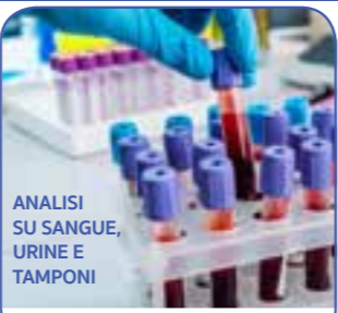
ANALISI SU SANGUE, URINE E TAMPONI