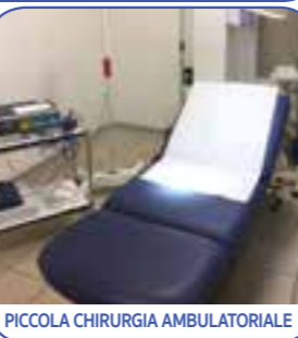
PICCOLA CHIRURGIA AMBULATORIALE