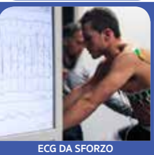
ECG DA SFORZO