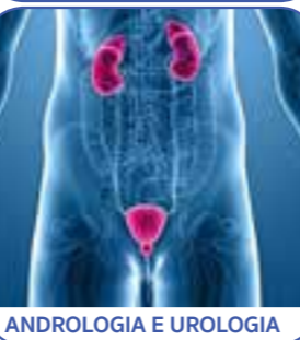
ANDROLOGIA E UROLOGIA