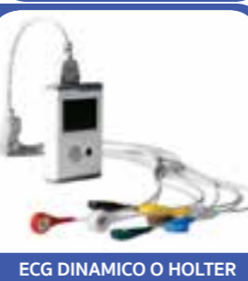
ECG DINAMICO O HOLTER