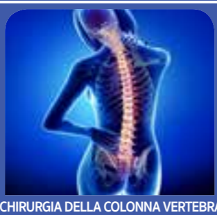
CHIRURGIA DELLA COLONNA VERTEBRALE