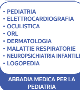
ABBADIA MEDICA PER LA PEDIATRIA