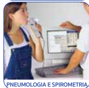
PNEUMOLOGIA E SPIROMETRIA