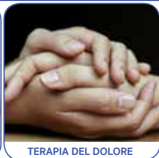
TERAPIA DEL DOLORE

Fisioterapia, Riabilitazione, Rieducazione