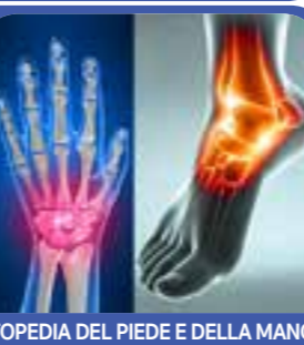
ORTOPEDIA DEL PIEDE E DELLA MANO