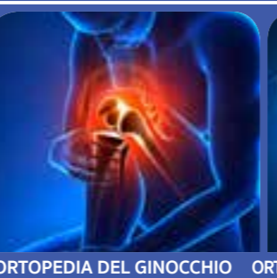
ORTOPEDIA DEL GINOCCHIO