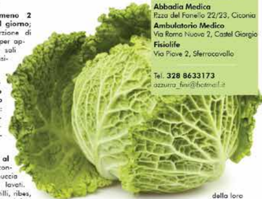
della loro azione diuretici

pere o prugne). Anche anguria e ananas sono indicati per il loro basso contenuto di sodio, elevato apporto di potassio ed effetto drenante.