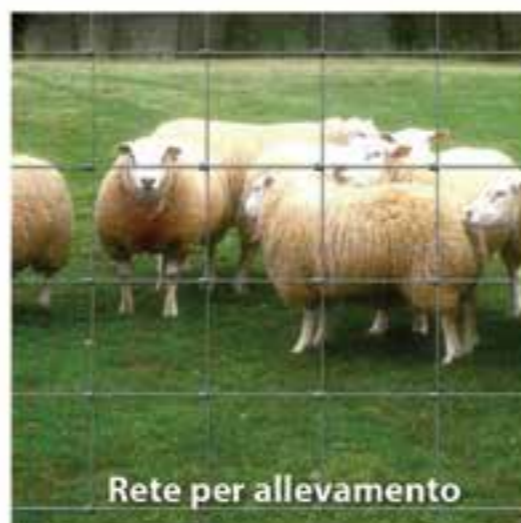
Rete per allevamento