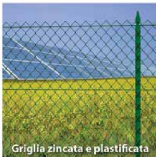
Griglia zincata e plastificata

Vasta gamma di prodotti Made in Italy ad un prezzo Eccezionale!!!