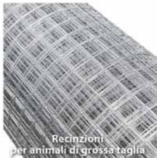
Recinzioni per animali di grossa taglia