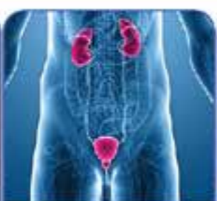
ANDROLOGIA E UROLOGIA