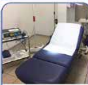
PICCOLA CHIRURGIA AMBULATORIALE