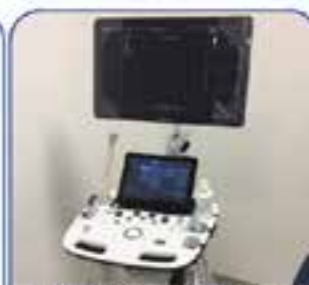
ECOGRAFICA E ECODOPPLER