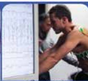
ECG DA SFORZO