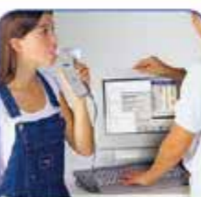
PNEUMOLOGIA E SPIROMETRIA