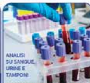
ANALISI SU SANGUE, URINE E TAMPONI