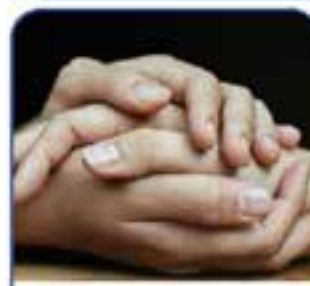
TERAPIA DEL DOLORE