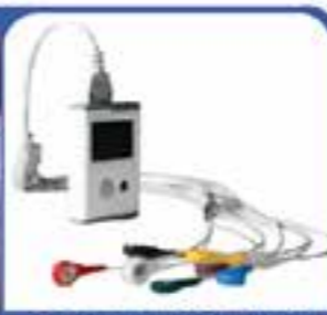
ECG DINAMICO O HOLTER