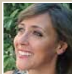
Foto a destra: risultato dopo correzione della asimmetria residua dei tessuti dell'emivolto destro.