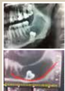
Figura in alto: presenza di voluminosa cisti odontogena con elemento dentario profondamente incluso a livello dell'angolo mandibolare sinistro. Figura in basso: si evidenzia lo stretto rapporto tra l'elemento dentario incluso e il nervo mandibolare e la vicinanza del dente al bordo della mandibola.

Questa condizione richiede un intervento di chirurgia maxillo-facciale per enucleare la cisti e estrarre l'elemento dentario profondamente incluso, evitando la perdita della sensibilità a livello del labbro. Non operando, in tale situazione si arriverebbe alla frattura spontanea della mandibola.