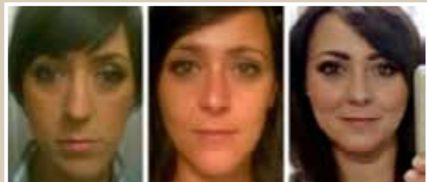
Foto a sinistra: dismorfia dento-scheletrica con deviazione della mandibola. Foto al centro: risultato dopo chirurgia correttiva della malocclusione dentale.