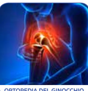
ORTOPEDIA DEL GINOCCHIO