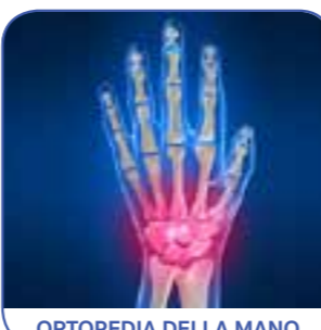
ORTOPEDIA DELLA MANO