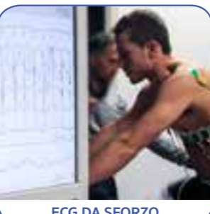
ECG DA SFORZO