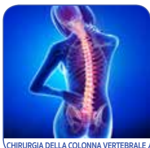
CHIRURGIA DELLA COLONNA VERTEBRALE