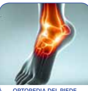
ORTOPEDIA DEL PIEDE