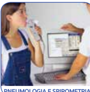
PNEUMOLOGIA E SPIROMETRIA