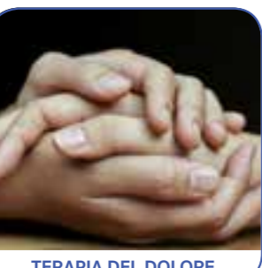
TERAPIA DEL DOLORE