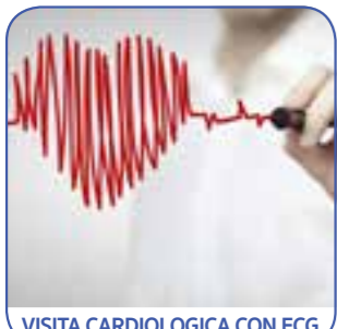
VISITA CARDIOLOGICA CON ECG