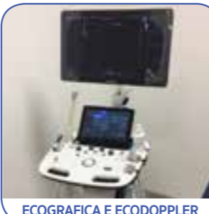
ECOGRAFICA E ECODOPPLER