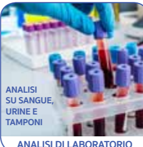
ANALISI SU SANGUE, URINE E TAMPONI