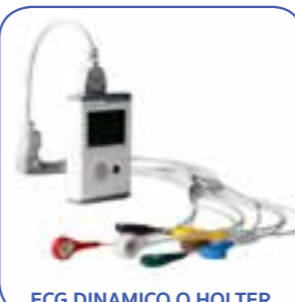
ECG DINAMICO O HOLTER