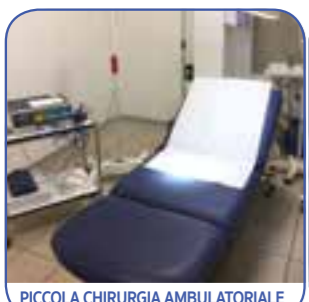
PICCOLA CHIRURGIA AMBULATORIALE