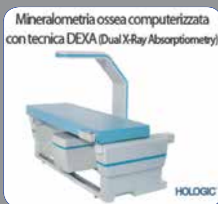
Mineralometria ossea computerizzata con tecnica DEXA (Dual X-Ray Absorptiometry)