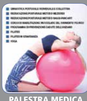
■ GIMNASTICA POSTURALE FORTIBLE E COLLETTA ■ NEUROFISIOLOGIA METODO MEDINA ■ NEUROFISIOLOGIA METODO BASSI PANGART ■ SOCRIO STABILIZATION METODO SGL FORTIBLE PULSO ■ PROGRAMMA DIVERSENTIOME CARTELLI DELL'INIZIARE ■ PILATES ■ PILATES IN STABILIZER ■ YOGA