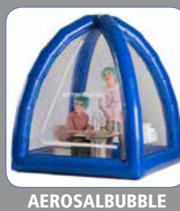
AEROSALBUBBLE stanza del sale