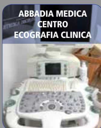
ABBADIA MEDICA CENTRO ECOGRAFIA CLINICA