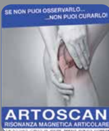
SE NON PUOI OSSERVARLO... ...NON PUOI CURARLO! ARTOSCAN RISONANZA MAGNETICA ARTICOLARE