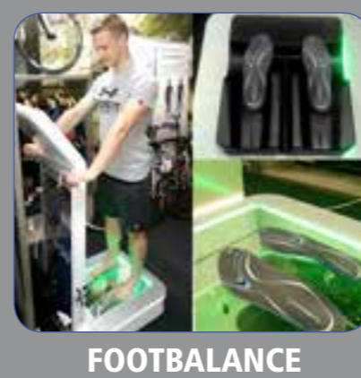
FOOTBALANCE 100% plantari personalizzati in pochi minuti