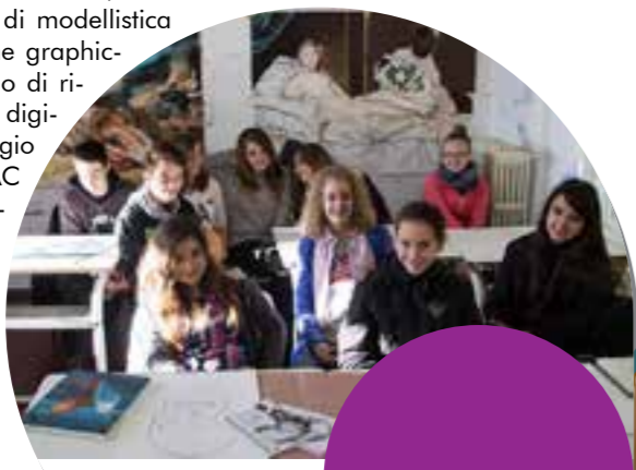
Cultura, innovazione e progettazione per le scelte del tuo futuro.

Date di scuola aperta: Domenica 14 Gennaio 2018 - h. 10.00-13.00/15.00-18.00; Sabato 27 Gennaio 2018 - h. 15.00/18.00; Domenica 04 Febbraio 2018 - h. 10.00-13.00/15.00-18.00