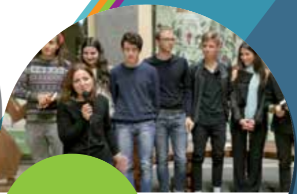
È classico ciò che persiste come rumore di fondo, anche là dove l'attualità più incompatibile fa da padrona".

I contatti sono validi per tutte le nostre scuole: Gli uffici di segreteria sono aperti: lunedì, mercoledì, venerdì, sabato dalle ore 11.00 alle ore 13.00, martedì e giovedì dalle ore 15.30 alle ore 17.00 Piazza Cahen Orvieto (TR) • Tel. 0763 342878 - Fax 0763 344582 • www.iisacp.gov.it • tris00200a@istruzione.it