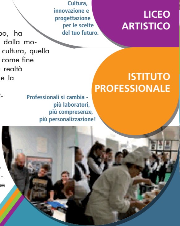
Professionali si cambia - più laboratori, più compresenze, più personalizzazione!

Date di scuola aperta: Sabato 13 Gennaio 2018 - h. 15.00/19.00; Sabato 27 Gennaio 2018 - h. 15.00/19.00; Domenica 4 Febbraio 2018 - h. 15.00/19.00.