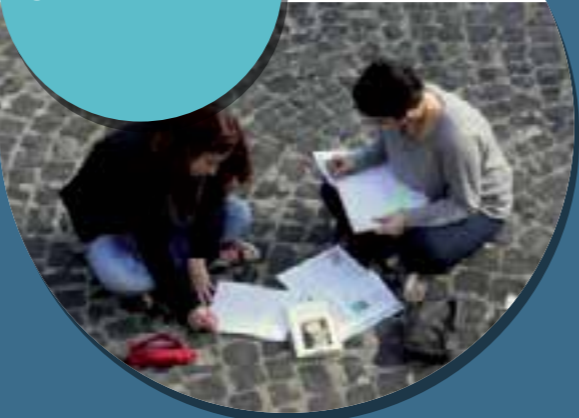
"Il sapere passa attraverso la relazione, non esiste una didattica se non entro una relazione umana" M. Recalcati

IL LICEO DELLE SCIENZE UMANE è indirizzato allo studio dei fenomeni collegati alla costruzione dell'identità personale e, nell'opzione economico-sociale, a quello delle scienze giuridiche, economiche e sociali. Nell'opzione base si approfondisce, infatti, la conoscenza della persona attraverso lo studio della Psicologia e delle Scienze dell'Educazione e si ampliano, nell'intero quinquennio, le Scienze Naturali e la cultura umanistica con la presenza del Latino. Nell'opzione economico-sociale si approfondisce la conoscenza del sistema socioeconomico, attraverso discipline quali Scienze giuridiche, economiche e sociali. La preparazione è arricchita da due lingue straniere, matematica e storia dell'arte. Date di scuola aperta: Sabato 13 Gennaio 2018 h. 15.00/19.00; Sabato 27 Gennaio 2018 h. 15.00/19.00; Domenica 4 Febbraio 2018 h. 15.00/19.00.