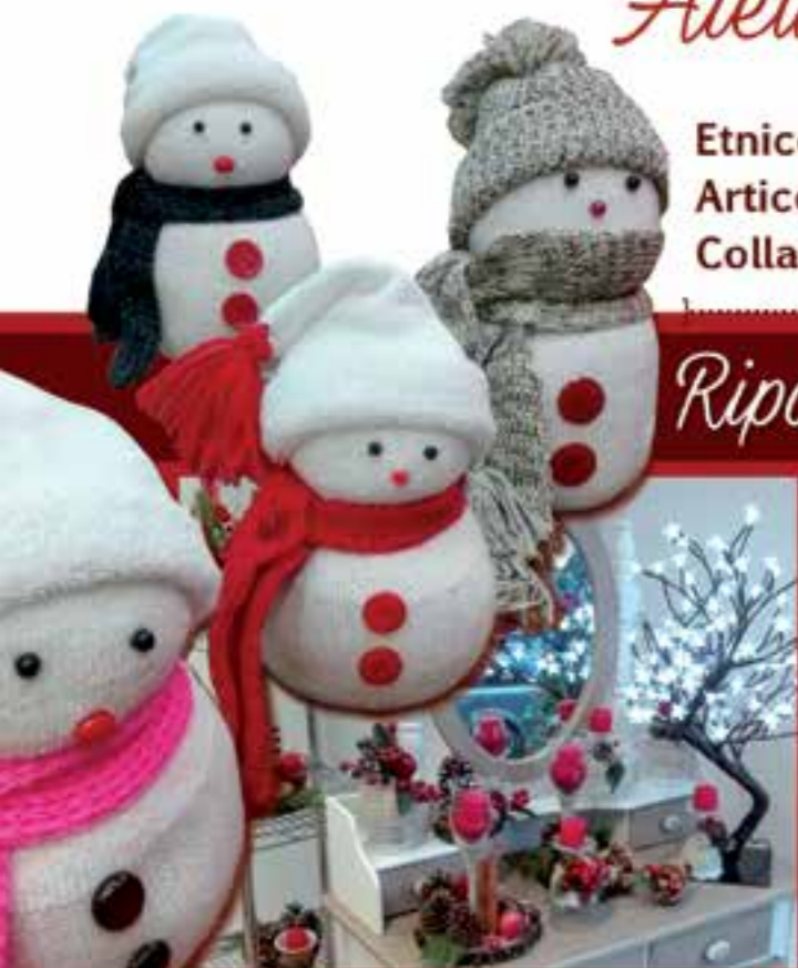
PICCOLI CORSI ARTIGIANALI