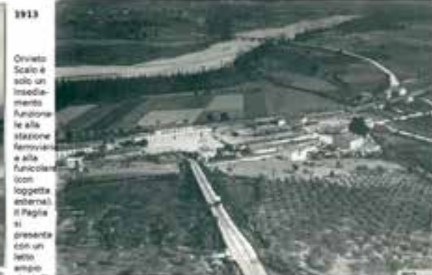
1913 Orvieto Scalo è solo un insediamento funzionale le alla stazione ferroviaria e alla funicolare (con loggetta esterna). Il Paglia si presenta con un letto ampio che infla perpendicolarmente il ponte dell'Adunata. Gli alberi sulla sponda destra che, in fila singola, non costituiscono ostacolo alle piene del fiume, testimoniano probabilmente di piantumazioni alla maniera di quelle effettuate, in sommità d'argine dall'istituto Poligrafico dello stato negli anni '50.

Le anse del ponte sono completamente libere da ostacoli e il letto del fiume, quasi piatto, dimostra che in caso di piena, il flusso delle acque è uniforme in tutte e 5 le arcate. Attualmente non è più così e sulla sponda sinistra si formano contemporaneamente cumuli di detriti. A destra in alto, i pini risultano capotruzzati per procurare foraggio agli animali (piante tenute a riparo).