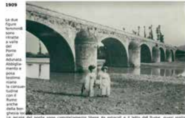
1909 Le due figure femminili sono ritratte a valle del Ponte dell'Adunata. Abbigliamento e gonnella sembrano essere la consueta tenuta con il fiume anche della famiglia dei...

Le anse del ponte sono completamente libere da ostacoli e il letto del fiume, quasi piatto, dimostra che in caso di piena, il flusso delle acque è uniforme in tutte e 5 le arcate. Attualmente non è più così e sulla sponda sinistra si formano contemporaneamente cumuli di detriti. A destra in alto, i pini risultano capotruzzati per procurare foraggio agli animali (piante tenute a riparo).