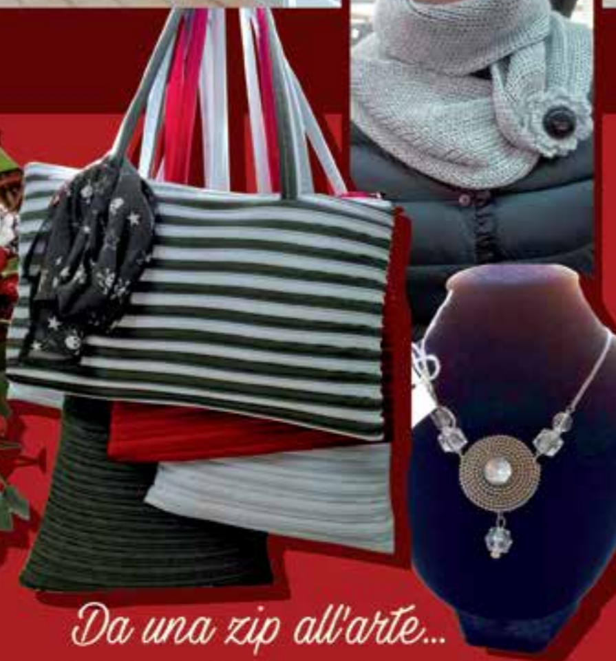
Da una zip all'arte...

PER NATALE TANTISSIME IDEE REGALO E OGGETTI PER LA CASA