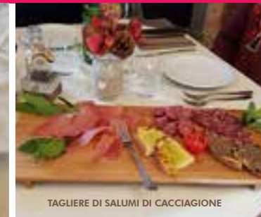
TAGLIERE DI SALUMI DI CACCIAGIONE