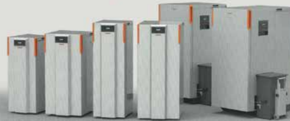
Compact, Compact Mini, Compact Max

Thermorossi opera con successo da oltre 45 anni nel settore del riscaldamento fino a diventare, oggi, una tra le più affermate ed avanzate industrie europee nella produzione di stufe e caldaie. Ogni apparecchio viene acceso in fabbrica e verificato per almeno 1 ora di funzionamento. I prodotti Thermorossi non necessitano di ulteriori per tarature e collaudi. Nel caso il pellet fosse di qualità diverse esistono differenti programmi di funzionamento selezionabili. Il grande cassetto cenere e le adeguate ispezioni per la pulizia semplificano la manutenzione mantenendo l'efficienza ai massimi livelli. Il pannello digitale LCD di nuovo design è implementato da messaggi grafici semplici ed intuitivi. Funzione crono per programmazione settimanale (tre accensioni e tre spegnimenti al giorno). MADE IN ITALY Thermorossi si avvale delle più moderne tecniche di produzione e tutti i prodotti sono conformi alle più severe normative europee.