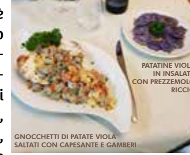
GNOCCHETTI DI PATATE VIOLA SALTATI CON CAPESANTE E GAMBERI