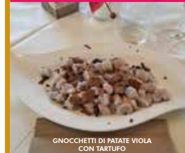
GNOCCHETTI DI PATATE VIOLA CON TARTUFO