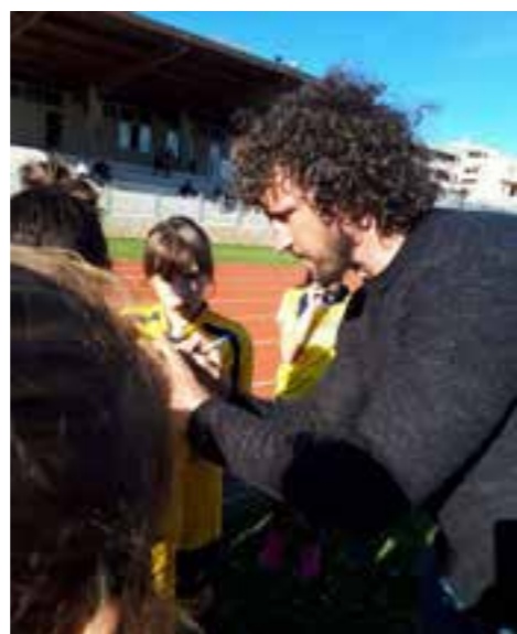
Emozionante è stato l’incontro con Mauro Bergamasco,

bambini e i ragazzi hanno giocato contro i loro coetanei provenienti da altre scuole italiane, hanno partecipato ai momenti istituzionali con la parata delle regioni, i discorsi delle autorità e si sono divertiti con i giochi organizzati dalla Polfer, promotore insieme alla FIR della manifestazione.