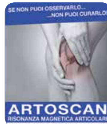
ARTOSCAN RISONANZA MAGNETICA ARTICOLARE