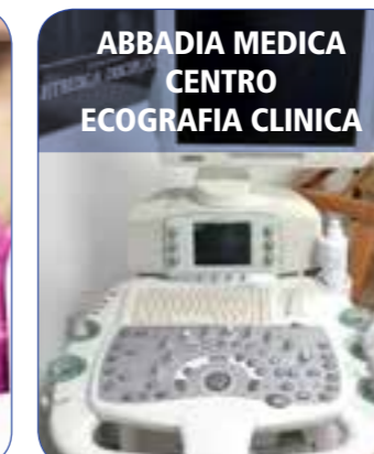
ABBADIA MEDICA CENTRO ECOGRAFIA CLINICA