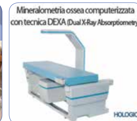
Mineralometria ossea computerizzata con tecnica DEXA (Dual X-Ray Absorptiometry)