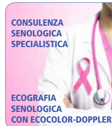
CONSULENZA SENOLOGICA SPECIALISTICA