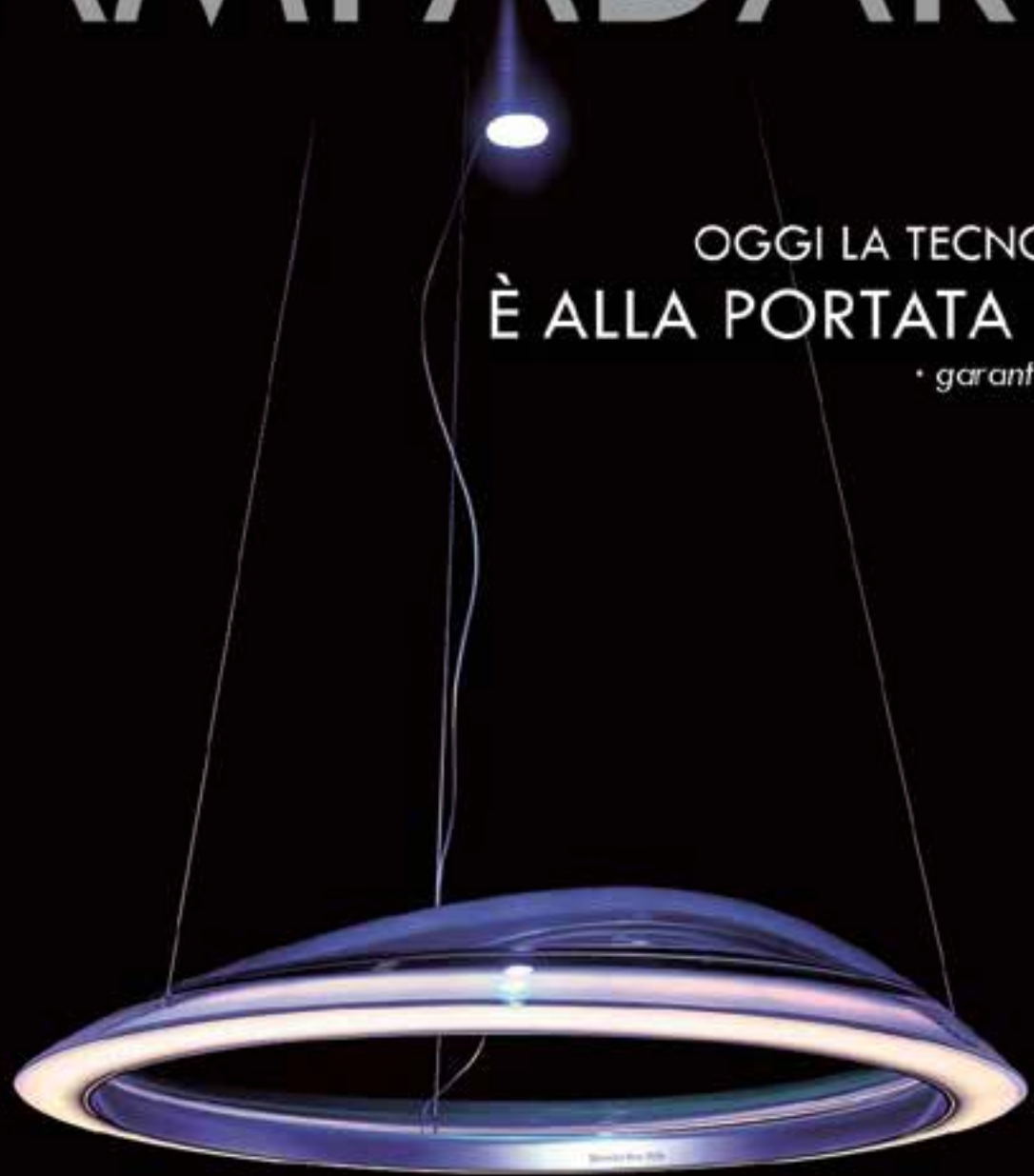
Ameluna Artemide Lampada a Sospensione

Ameluna combina bellezza e intelligenza attraverso una forma totalmente trasparente che si fonde con una luce dinamica per creare infiniti scenari. E' un'interazione tra forme pure e un sensuale volume asimmetrico che crea una tensione dinamica ed altamente emotiva. Ameluna rivela una rivoluzionaria optoelettronica integrata nel corpo trasparente.