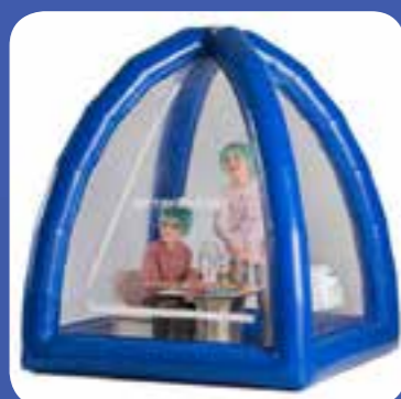
AEROSALBUBBLE stanza del sale