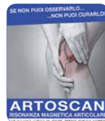
ARTOSCAN RISONANZA MAGNETICA ARTICOLARE

VISITE PER RINNOVO E RILASCIO PATENTI DI GUIDA