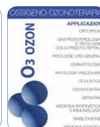
OSSIGENO-OZONOTERAPIA O 3 OZONO