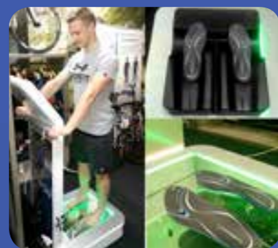
FOOTBALANCE 100% plantari personalizzati in pochi minuti