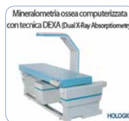
Mineralometria ossea computerizzata con tecnica DEXA (Dual X-Ray Absorptiometry)