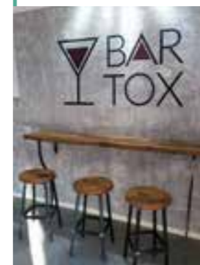
BarTox , Ficule.

Si tratta di una branca della decorazione che pur partendo da pennelli e colori sconfinava poi nella psicologia del marketing e della comunicazione. Per rinnovare e decorare un locale pubblico è infatti necessaria un'accurata progettazione che tenga conto della tipologia del locale , del target a cui è rivolto, del messaggio che il locale vuole mandare e delle aspettative del proprietario riguardo alla risposta da parte dei clienti . Una volta definito il tutto e realizzato il progetto di decorazione, si procede con il lavoro sul campo che attraverso colori e pennelli porterà alla materializzazione delle idee sulle pareti. Nel corso degli anni ho realizzato diverse decorazioni per locali pubblici e oggi vorrei presentarvene 3.