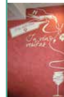
Bar Pano-b , Centro commerciale Porta D'Orvieto.

lustro alla sala con una decorazione e dall'altro sottolineare il legame inscindibile tra il centro sociale e il territorio. Abbiamo così deciso di realizzare un trompe-l'œil che rappresentasse il paesaggio fluviale di Orvieto e del suo fiume Paglia visto dal Ponte dell'Adunata.