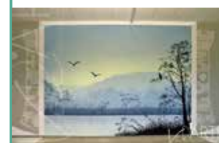
Sala Corsica , Ciconia.