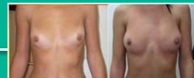
Seno – Numero trattamenti 10 (1 per settimana) ← Risultato ottenuto dopo 10 settimane Aumento di volume e rassodamento