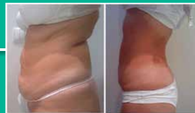
Adipe Liposculptura – Numero trattamenti 4, ← Risultato ottenuto dopo 4 trattamenti (4 settimane) Riduzione massa grassa, modellamento corpo

Agire al di sotto della soglia del fastidio. FINALMENTE UN TRATTAMENTO PIACEVOLE