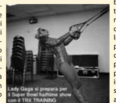
Lady Gaga si prepara per il Super Bowl halftime show con il TRX TRAINING

L'Allenamento in Sospensione è una moderna tecnica di allenamento che fa parte dell'Allenamento Funzionale. Si effettua utilizzando un attrezzo costituito da cinghie e maniglie che fanno sì che l'atleta si alleni sfruttando il proprio peso corporeo. Il nome commerciale di questo attrezzo è TRX. L'Allenamento in Sospensione si effettua attraverso una serie di esercizi in cui il proprio corpo è fortemente sbilanciato allo scopo di migliorare la forza, l'equilibrio e la resistenza, soprattutto a carico del core, il sistema muscolare fondamentale per il controllo della postura. Il TRX e il programma di allenamento sono stati sviluppati da Randy Hetrick, ex soldato delle forze speciali della marina statunitense negli anni 90, mentre la commercializzazione è iniziata nel 2005. Il TRX è un attrezzo d'allenamento, Semplice, funzionale, versatile e pratico! Una delle peculiarità di questa tecnica di training è il fatto di poter essere utilizzata da un vastissimo numero di persone con i più svariati livelli di preparazione, in quanto tutti i movimenti possono essere adattati variando la posizione del corpo e di conseguenza modificando la difficoltà degli stessi. Il TRX, molto diffuso in america, viene utilizzato quotidianamente dalle forze armate, da professionisti di