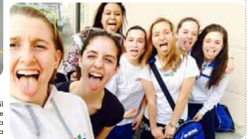
Le giovani cestiste acquiesane della Azzurra Vetrya Orvieto U14 impegnate nella fase finale del campionato.