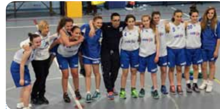
La Azzurra Vetrya Orvieto U17 seconda alla Final 3. Coach Tringali ringrazia il suo splendido e giovanissimo gruppo.

e.f. - Ufficio Stampa Azzurra Ceprini Orvieto.