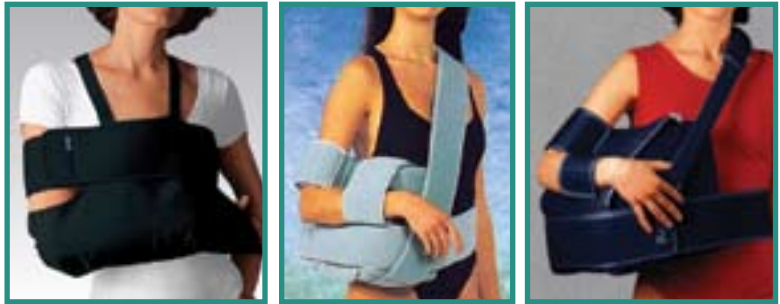
immobilizzatore spalla Tutore per abduzione spalla da 15° Tutore per abduzione spalla da 45°

Il trattamento di tali patologie è molto vario, in base al tipo ed alla gravità in cui esse si esplicano. Spesso, però, si ha necessità di ricorrere all'intervento chirurgico, seppure in artroscopia seguito poi, da riabilitazione.