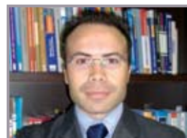
A cura di: Rag. Andrea Rellini Consulente fiscale e del Lavoro Partner STUDIO RB

per i datori di lavoro in caso di omissso versamento di ritenute previdenziali operate per i lavoratori dipendenti.