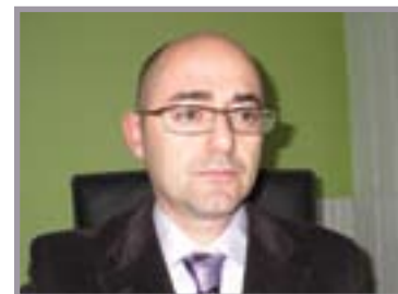
A cura di: Dott. Bartolini Marco Dottore Commercialista Revisore dei Conti Partner STUDIO RB

i molteplici contenziosi in essere e, soprattutto, in modo da scongiurare una futura instaurazione di una dispendiosa attività contenziosa.