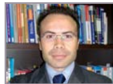
A cura di: Rag. Andrea Rellini Consulente fiscale e del Lavoro Partner STUDIO RB

tometro potrà essere applicato quando, anche solo per un anno lo scostamento del reddito dichiarato da quello presunto è pari ad almeno il 20%.