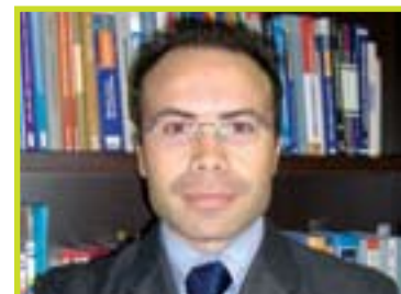
A cura di: Rag. Andrea Rellini Consulente fiscale e del Lavoro Partner STUDIO RB

ferma che deve essere il contribuente a fornire la prova contraria a dimostrazione dell'inesistenza totale o parziale del reddito presunto calcolato dal fisco.