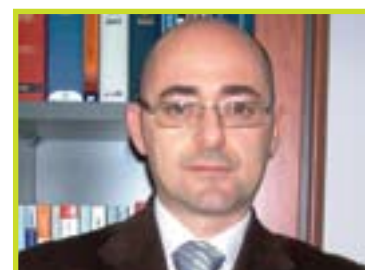
A cura di: Dott. Bartolini Marco Dottore Commercialista Revisore Contabile Partner STUDIO RB

il loro reddito deriva da attività commerciale ex art. 2195 C.c., cioè reddito d'impresa, con conseguente automatica sussistenza del requisito dell'autonoma organizzazione.