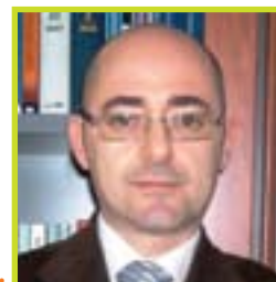
A cura di: Dott. Bartolini Marco Dottore Commercialista Revisore Contabile Partner STUDIO RB

pagare alcuna imposta all'atto della distribuzione della riserva. Per ogni approfondimento visitate www.studiorborvieto.it .