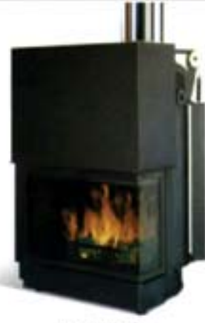
Acquatondo un lato vetrato