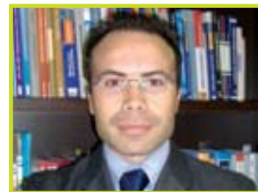
A cura di: Rag. Andrea Rellini Consulente fiscale e del Lavoro Partner STUDIO RB

to per almeno 15 giorni è computato per intero; oppure il caso del decesso del proprietario dell'immobile nel corso del 2009, dove l'ICI va imputata al defunto fino alla data del decesso e agli eredi dalla data del decesso fino al 31.12.2009.