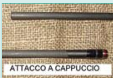
ATTACCO A CAPPUCCIO

Lo spinning diventò una delle tecniche di pesca più giovani ed innovative e ci fu anche un'evoluzione sul tipo di innesti, come il tipo a "cappuccio" e lo "spigot".