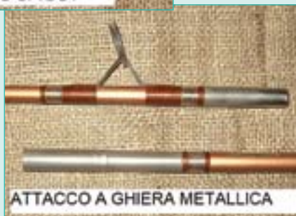
ATTACCO A GHIERA METALLICA

una sezione di carbonio inserita nell'impugnatura e anche negli altri eventuali pezzi della canna ai quali viene fissata con collanti e resine industriali, per garantire la massima unione col corpo della stessa.