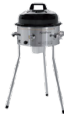
Barbecue a gas in acciaio