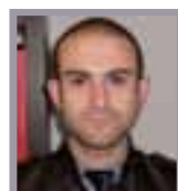
A cura di: Lorenzo Rumori Esperto del Lavoro ed elaborazione buste paga. Partner STUDIO RB

Con la pubblicazione in Gazzetta Ufficiale della Legge n. 15/2014 in data 28/02/2014