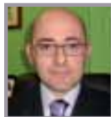
A cura di: Dott. Bartolini Marco Dottore Commercialista; Revisore dei Conti; Curatore fallimentare, Tribunale di Terni. Partner STUDIO RB

Prestare del denaro è "ancora" ammesso. Tale operazione può essere disciplinata attraverso un contratto di mutuo (art. 1813 c.c.).