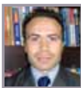
A cura di: Rag. Andrea Rellini Consulente fiscale e del Lavoro. Partner STUDIO RB

A seguito di una precisa richiesta di interpello dell'Agenzia delle Entrate al Ministero dell'Economia e Finanza (MEF) in merito "a delucidazioni sulla tracciabilità dei pagamenti dei canoni di locazione ad uso abitativo" lo stesso MEF con nota numero 10492 del 5 febbraio 2014 ha risposto in via interpretativa che nel 2014 si