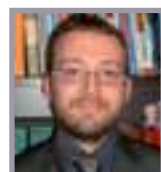
A cura di: Rag. Francesco Argentin Consulente del Lavoro. Partner STUDIO RB

La Direzione Generale per l'Attività Ispettiva del Ministero del Lavoro e delle Politiche Sociali, con la nota n. 2642 del 6 febbraio 2014, determina che il datore di lavoro che retribuisce lo straordinario al dipendente, senza che il valore venga riportato nel Libro Unico del Lavoro, ovvero "fuori busta", è