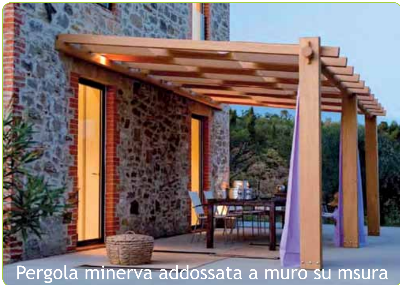
Pergola minerva addossata a muro su misura

Struttura in legno con trattamento protekt PROTEKT