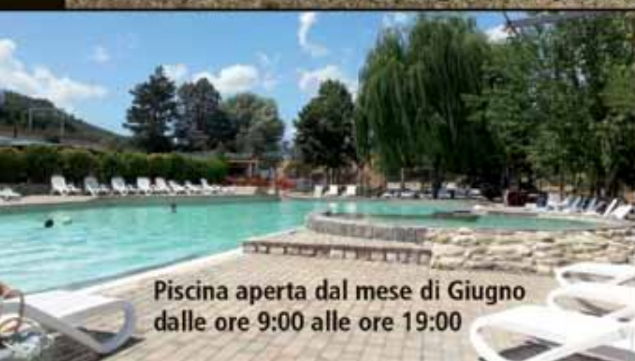
Piscina aperta dal mese di Giugno dalle ore 9:00 alle ore 19:00