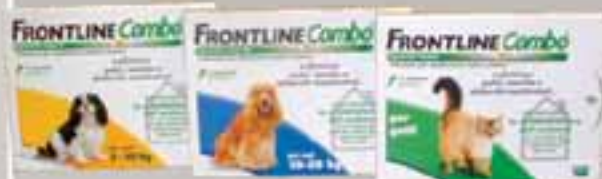
FRONTLINE COMBO su tutta la linea -20%