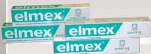
ELMEX DENTIFRICIO € 2,90 (cad)