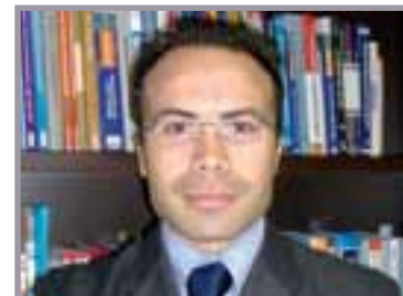
A cura di: Rag. Andrea Rellini Consulente fiscale e del Lavoro. Partner STUDIO RB

la nuova norma si limiterà solo a fissare i termini di pagamento, per altro derogabili tra le parti, e la decorrenza degli interessi moratori senza la previsioni di sanzioni.