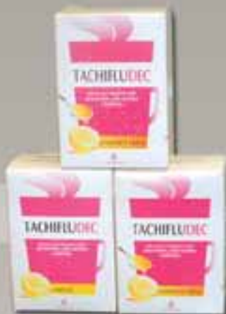
TACHIFLUDEC € 5,90 (cad)