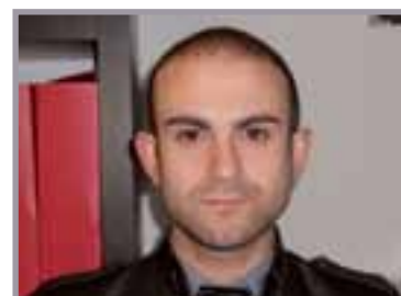
A cura di: Lorenzo Rumori Esperto del Lavoro ed elaborazione buste paga. Partner STUDIO RB

la dimostrazione di origini italiane) residenti in Argentina, Uruguay, Venezuela, Brasile; - 11.750 unità per conversioni del permesso di soggiorno da altro titolo a lavoro subordinato. Le domande per entrare in tali quote devono essere presentate solamente per via telematica dopo specifica registrazione, dal sito del Ministero dell'Interno a partire dalle ore 9. del giorno 07/12/2012.