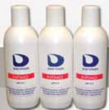
DERMON INTIMO € 3,90 (cad)