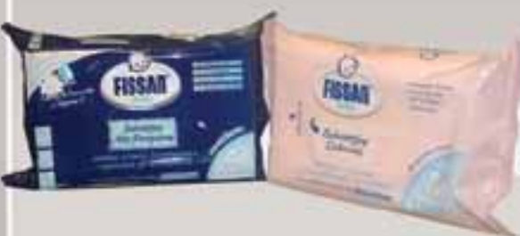
SALVIETTE FISSAN € 1,99 (cad)