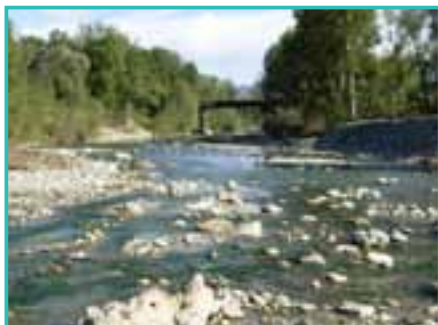
Vista della passerella in una foto della primavera 2012: è seminascosta dalla vegetazione che ne costituisce un potenziale ostacolo

www.lenzaorvietana.it - info@lenzaorvietana.it