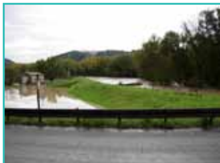
Un esempio lampante di come un argine ben costruito lungo il Chiani abbia salvato la zona dell'ex Sansificio