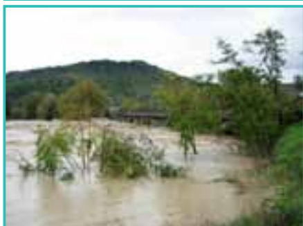
Le acque che passano sotto il Ponte dell'Adunata incontrano l'ostacolo della vegetazione cresciuta in modo incontrollato