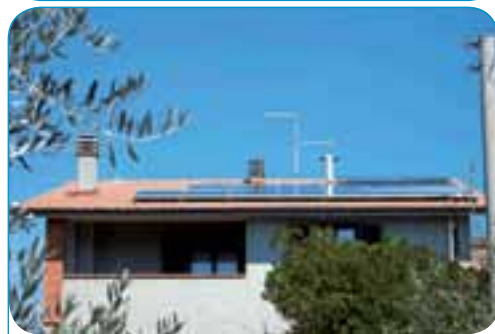
- Impianto a tetto di Kw 2,99 - Ficulle (TR)