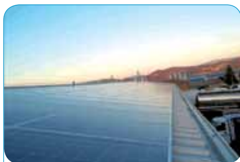
Cliente: MIRA - Impianto a tetto di Kw 86,40 - Via dei Funari, Orvieto (TR)