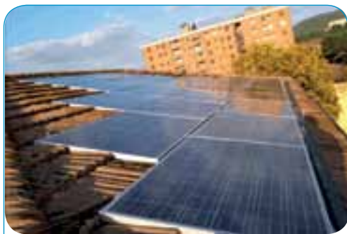
- Impianti a tetto di Kw 2,99 cad. - Via dei Tigli, Orvieto (TR)