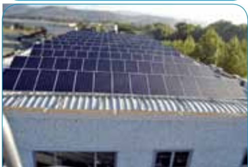
Cliente: TRENTAVIZI - 2 impianti a tetto di Kw 52,44 e Kw 41,40 per un totale di 93,84 Kw. - Via dei Fornaciari, Orvieto (TR)