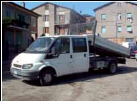
Ford Transit ribaltabile trilaterale, 7 posti, anno 2005