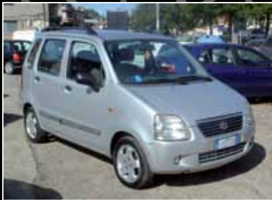
Suzuki wagon R c.c. 1300, clima, gancio, anno 2001