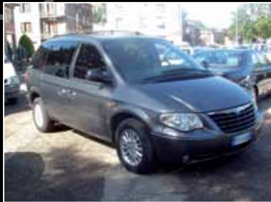
Chrysler voyager, c.c. 2800, 7 posti, anno 2006, pelle, clima, full opt.