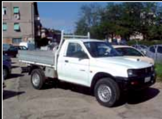
Mitsubishi L 200 pick up anno 1998, completamente revisionato, meccanica, gomme, carrozzeria, garantito