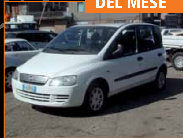
Fiat Multipla, c.c. 1600, benzina con impianto a metano, anno 2006