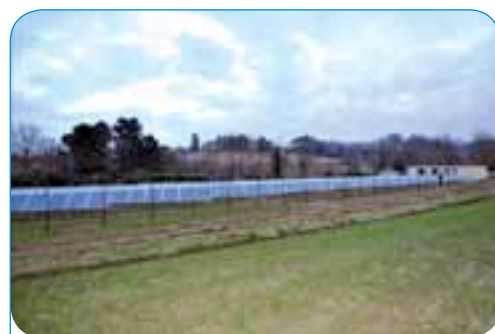
Cliente: DAL SAVIO - Impianto a terra di Kw 200 - Loc. Vicinove - Monteleone d'Orvieto (TR)