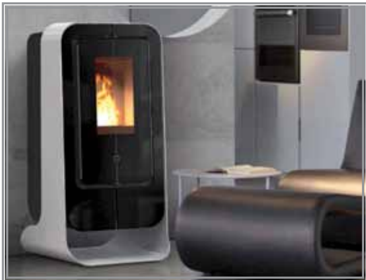
Ciao , il nuovo archetipo di stufa che guarda al futuro con un design giovane e moderno.

LE GRANDI NOVITÀ OFFERTE DA VERA PER L'INVERNO 2012: