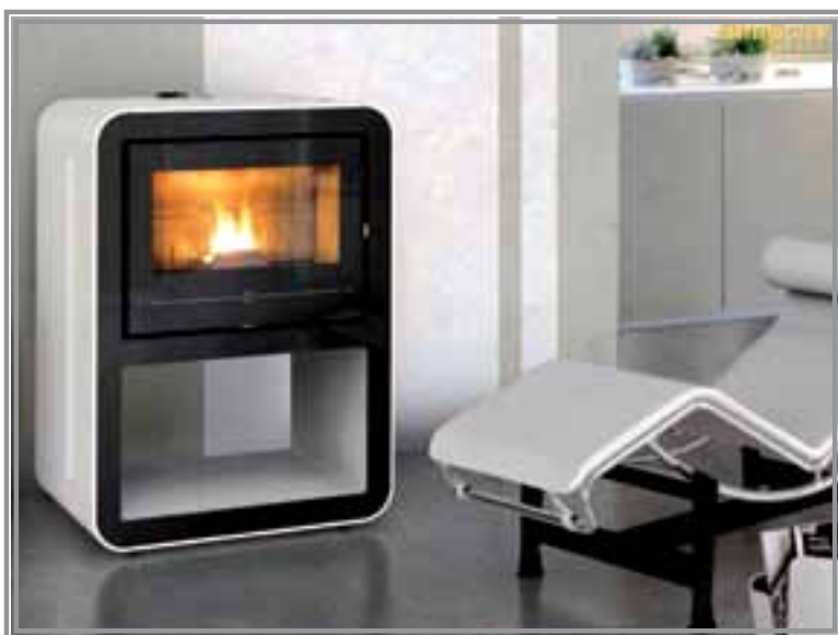
Cuba 10 e 12 , il caminetto a pellet moderno e comodo, che non necessita di opere murarie o complesse procedure nell'installazione.