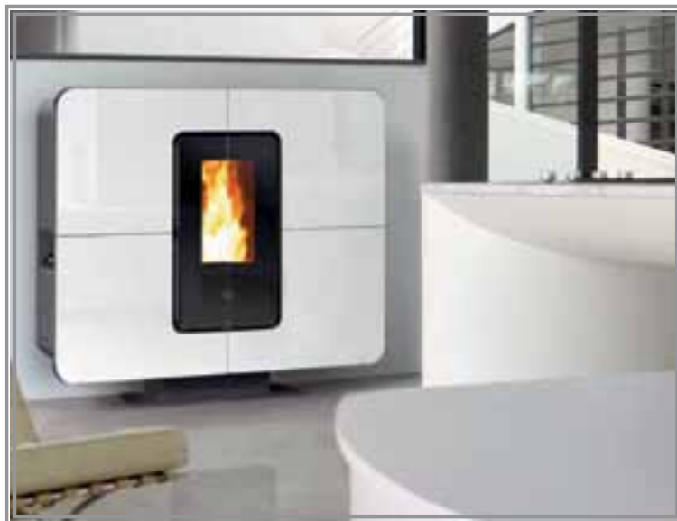
Slimquadro 11Kw, edizione potenziata del nostro imitatissimo prodotto salva spazio.