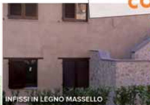
INFISSI IN LEGNO MASSELLO