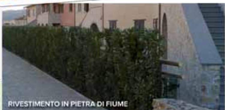
RIVESTIMENTO IN PIETRA DI FIUME

ufficio vendite Immobiliare Mossa del Palio srl Orvieto Scalo