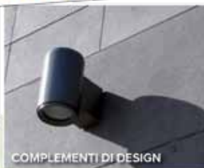
COMPLEMENTI DI DESIGN