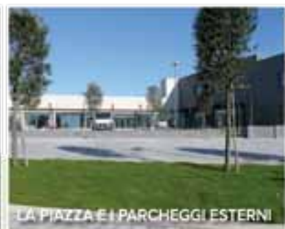
LA PIAZZA E I PARCHEGGI ESTERNI