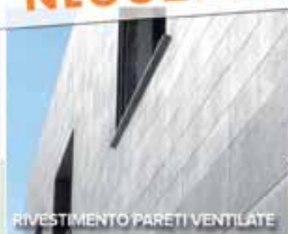
RIVESTIMENTO PARETI VENTILATE