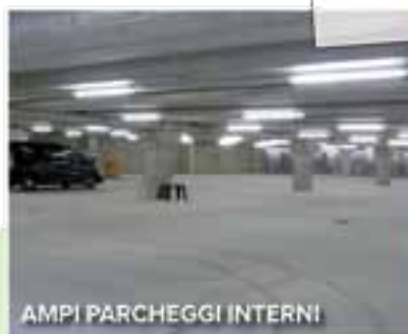
AMPI PARCHEGGI INTERNI