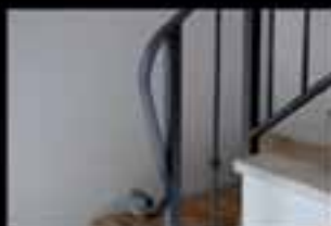
Ringhiere artigianali in ferro battuto