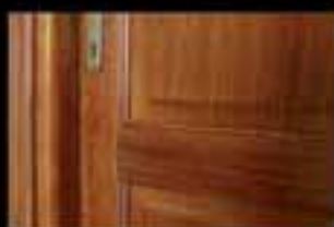
Porte interne in legno massello