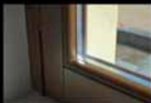
Finestre anti-infiltrazione da 11 mm + 4 mm