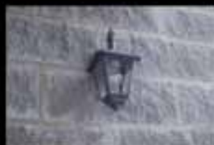
Rifiniture esterne di pregio

La 39Kappa S.r.l. propone a Viceno villette costruite in modo artigianale per essere solide ed accoglienti, silenziose e salutarie, dove lo stile si integra con la bio-edilizia e la qualità italiana si incontra con la convenienza.