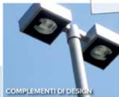
COMPLEMENTI DI DESIGN