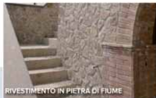
RIVESTIMENTO IN PIETRA DI FIUME

ufficio vendite Immobiliare Mossa del Palio srl Orvieto Scalo