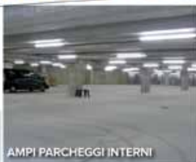
AMPI PARCHeggi INTERNI