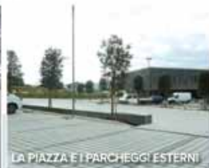
LA PIAZZA E I PARCHeggi ESTERNI