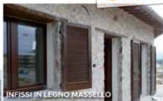
INFISSI IN LEGNO MASSELLO