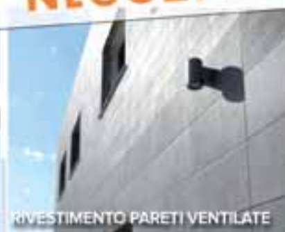
RIVESTIMENTO PARETI VENTILATE