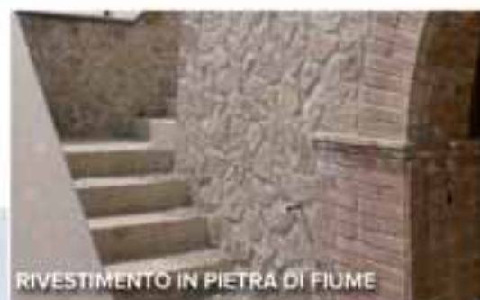
RIVESTIMENTO IN PIETRA DI FIUME

ufficio vendite Immobiliare Mossa del Palio srl Orvieto Scalo