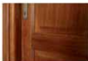
Porte interne in legno massello