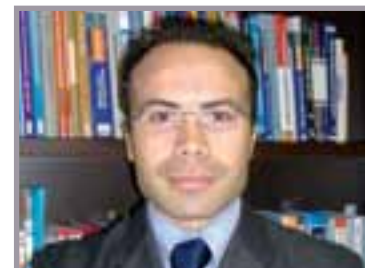
A cura di: Rag. Andrea Rellini Consulente fiscale e del Lavoro. Partner STUDIO RB

portate rispettivamente a 400.000 euro per le prestazioni di servizi ed a 700.000 euro le altre attività.