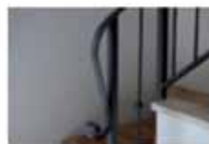
Ringhiere artigianali in ferro battuto