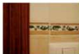
Greche di prima scelta