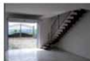
Taverna con accesso diretto dal box