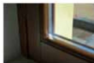
Finestre anti-intrusione da 11 mm + 4 mm

info: Tecnocasa Via dei Sette Martiri, 46 Orvieto Tel. 0763.390023