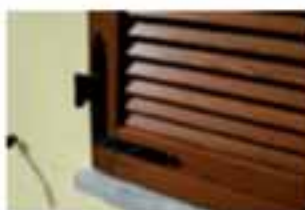
Persiane artigianali in legno massello