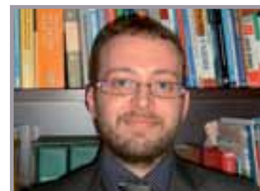
A cura di: Rag. Francesco Argentin Consulente del Lavoro. Partner STUDIO RB