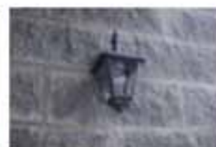
Rifiniture esterne di pregio