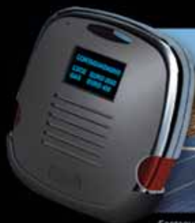
Contagugadagno in dotazione

I Beghelli Point presentano Il Tetto D'oro Acqualuce, il rivoluzionario sistema che con il sole produce contemporaneamente energia elettrica e acqua calda per le nostre case. Un'occasione unica per abbattere le bollette di luce e gas e produrre fino al 100% dell'energia elettrica necessaria e fino al 90% circa dell'acqua calda. Con un servizio "chiavi in mano" davvero completo: dalla gestione delle pratiche per la richiesta degli incentivi statali, all'erogazione di eventuali finanziamenti, fino alla totale assistenza nelle fasi di progettazione, installazione e manutenzione dell'impianto.