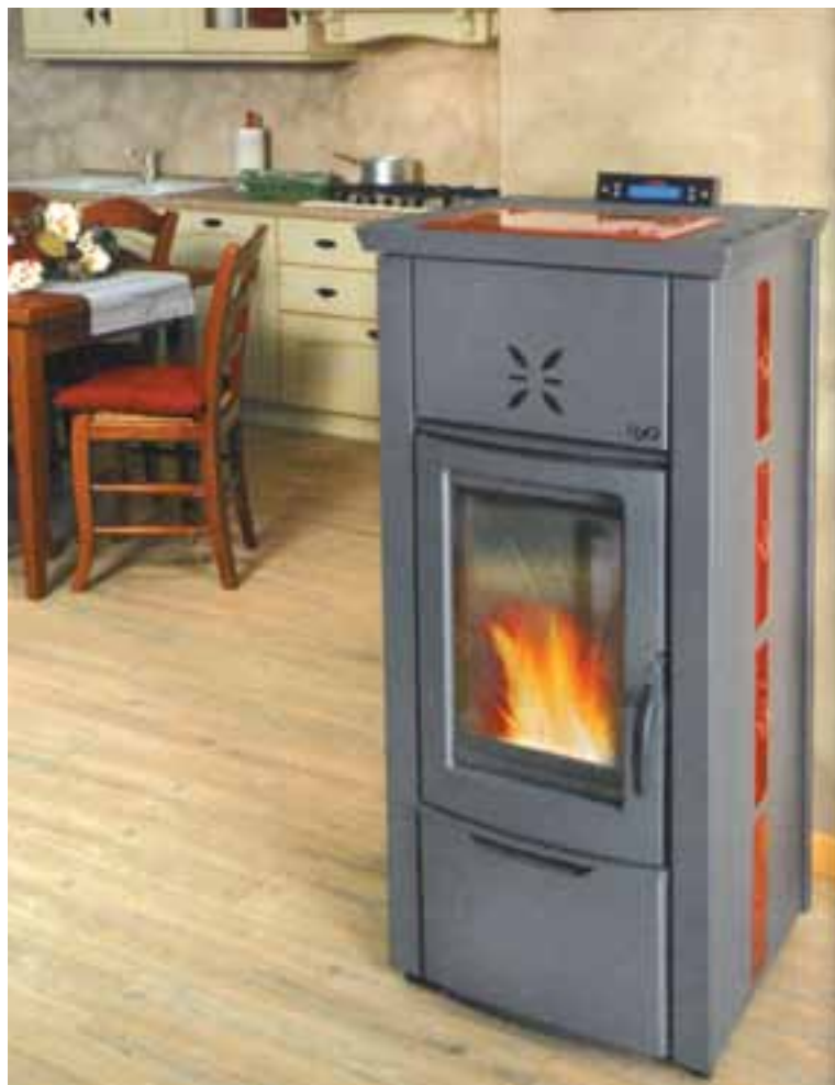
H 2 O FIORI