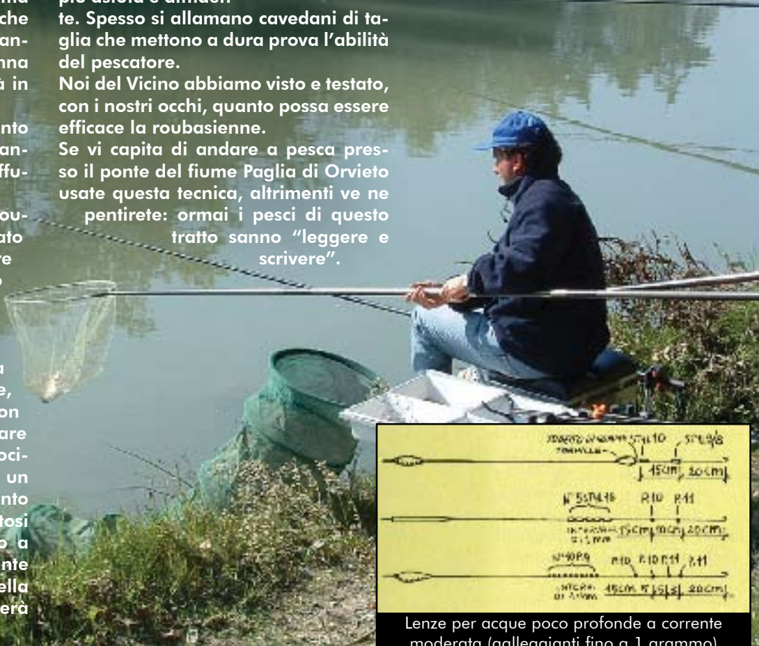
Lenze per acque poco profonde a corrente moderata (galleggianti fino a 1 grammo)