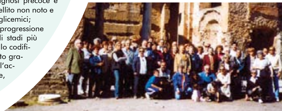
L'associazione ADO in gita a Villa Adriana (Tivoli) - Settembre 2002